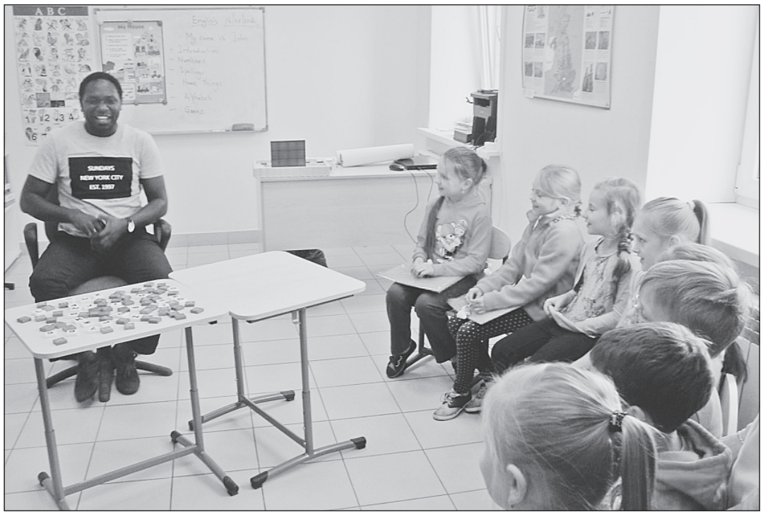
Встречи с иностранцами в «Hello!» — нередкое явление! (Лето 2016 года)

Штаб лагеря располагается по адресу: ул. Сушанская, 6В (на втором этаже кафе «Гиза»). Справки по тел. 8-906-204-48-96.